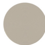
07 AVERY TAPPETO CM Ø 400